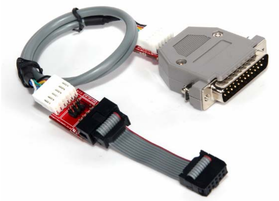
AD-ISPPro 와 연결하여 사용