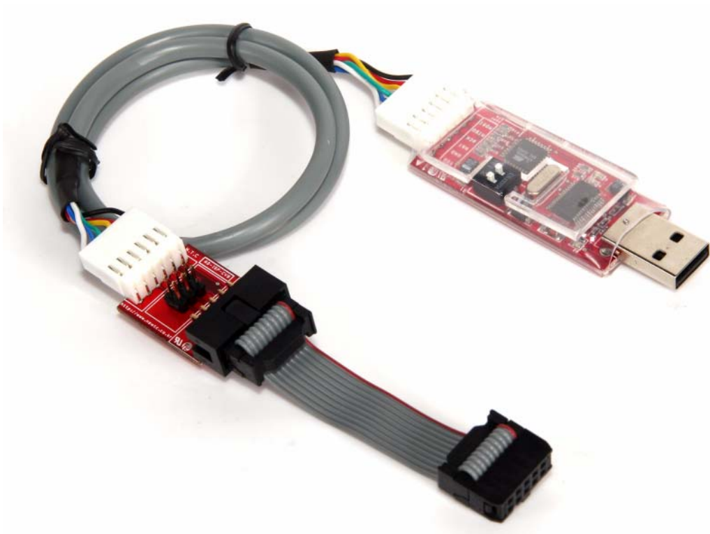
AD-USBISP 와 연결하여 사용